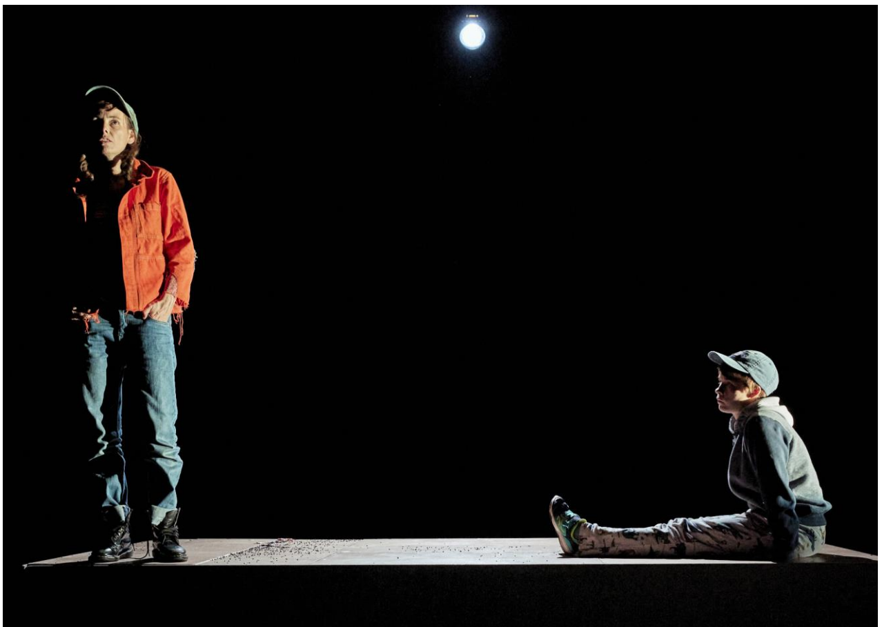
@Christophe Raynaud de Lage