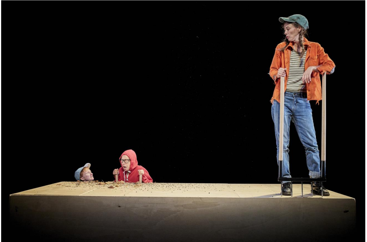
@Christophe Raynaud de Lage